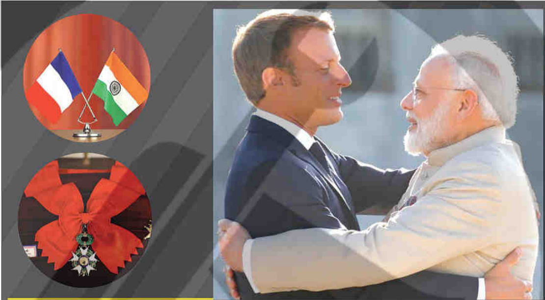
प्रधानमंत्री श्री नरेंद्र मोदी को फ्रांस के राष्ट्रपति श्री इमैनुएल मैक्रॉन द्वारा ग्रैंड क्रॉस ऑफ द लीजन ऑफ ऑनर से सम्मानित किया गया, यह नागरिक और सैन्य सम्मान पाने वाले पहले भारतीय प्रधानमंत्री हैं।

भा रत और फ्रांस ने भारत की स्वतंत्रता की शताब्दी के महत्वपूर्ण अवसर से पहले अगले 25 वर्षों में परस्पर सहयोग को आगे बढ़ाने के लिए 'Horizon 2047' नामक रोडमैप तैयार किया है। इसके अतिरिक्त, यह पहल भारत-फ्रांस रणनीतिक साझेदारी के उल्लेखनीय 50-वर्षों की उपलब्धियों के स्मरणोत्सव के संदर्भ में भी है। यह दूरदर्शी दृष्टिकोण दोनों देशों के रिश्ते को और भी अधिक ऊंचाइयों तक ले जाने के लिए तैयार है। इस रोडमैप की घोषणा प्रधानमंत्री श्री नरेंद्र मोदी की हाल की पेरिस यात्रा के दौरान की गई। इसने रक्षा, जलवायु परिवर्तन, ऊर्जा परिवर्तन, अंतरिक्ष सहयोग, समुद्री अर्थव्यवस्था, बहुपक्षवाद और आतंकवाद से निपटने के क्षेत्रों सहित विभिन्न क्षेत्रों में मजबूत गठबंधन के लिए आधार तैयार किया। 'Horizon 2047' तीन अत्यंत महत्वपूर्ण स्तंभों पर जोर देता है: (1) सुरक्षा